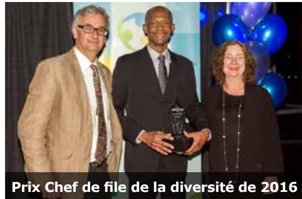
Prix Chef de file de la diversité de 2016

600 entreprises, représentées par plus de 1,000 personnes, ont reçu le Communiqué EIO.